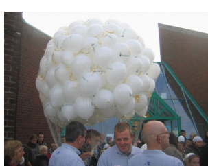
Lâché de ballons