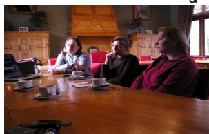
Services publics : Etat Civil & Population & Zone de Police