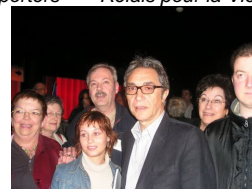
Rencontre de nos membres avec Richard Berry