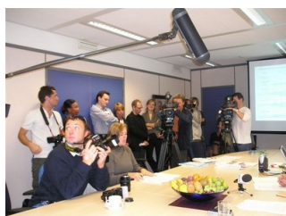
Conférence de Presse