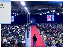
Evènementiel 1750 Jeunes 17-20 ans