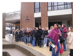
Visite Centre transplant