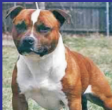
English terrier (st.bull-terrier).