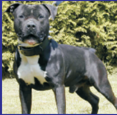
American staffordshire terrier

13 races de chiens sont réputées dangereuses :