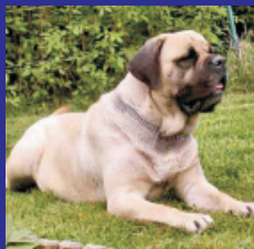
Mastiff (toute origine)