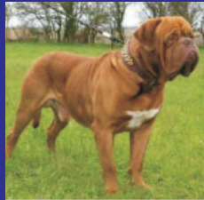
Dogue de Bordeaux