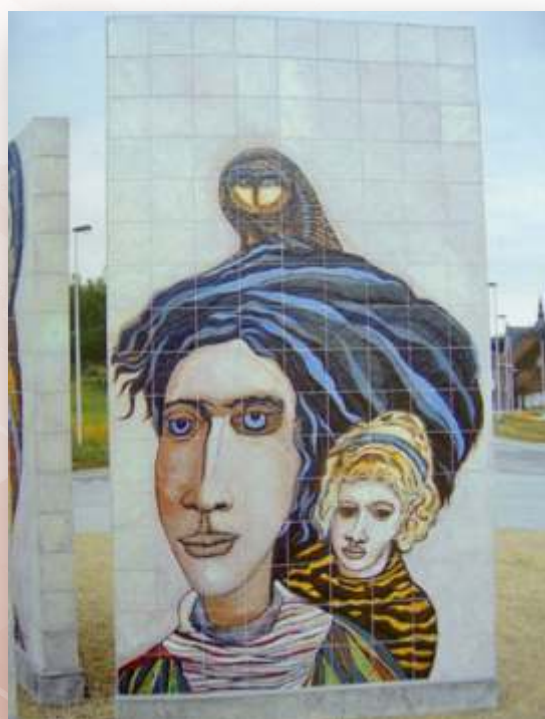
Le signal (céramiques) au Rond-point de Bruyelle ( 85m2)