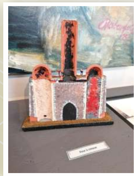
Maquettes de fours