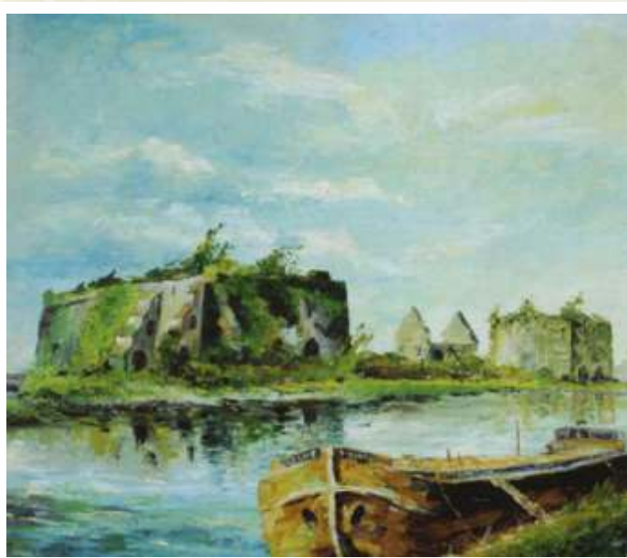
Les Fours Crèveœur à Antoing (huile sur toile) Collection Ville d'Antoing

Il réalise également des maquettes représentant les fours à chaux et le travail de la pierre qui se trouvent aujourd'hui à l'Exposition « Le Triangle Blanc, la pierre et les hommes » à la Maison rurale de Calonne.