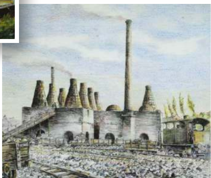
Deux fours haute cheminée, 1993 Collection Ville d'Antoing