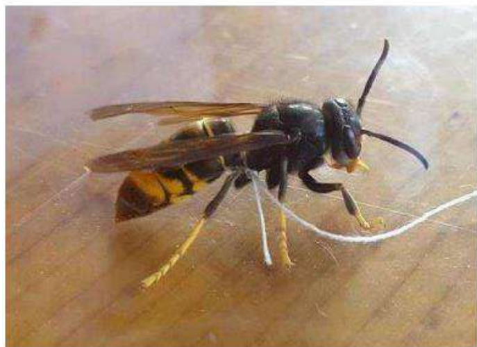
Caractéristiques du frelon asiatique : thorax noir, extrémités des pattes jaunes

Introduit accidentellement près de Bordeaux, le frelon asiatique a colonisé plus de 80 % du territoire français en 15 ans. Après un premier nid découvert dans le Tournaisis, il est actuellement présent partout en Wallonie.